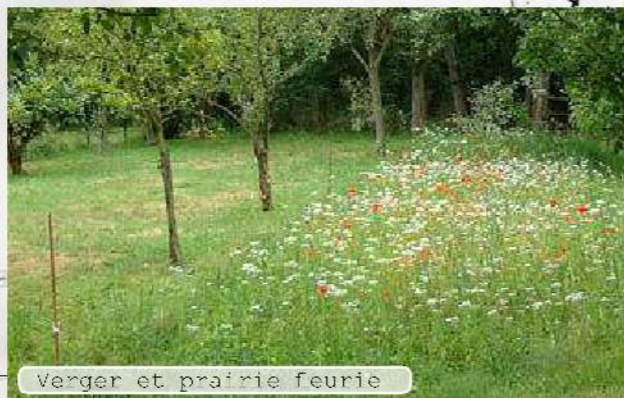
Verger et prairie fleurie