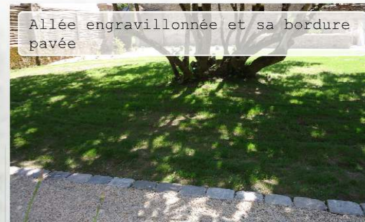
Allée engravillonnée et sa bordure pavée