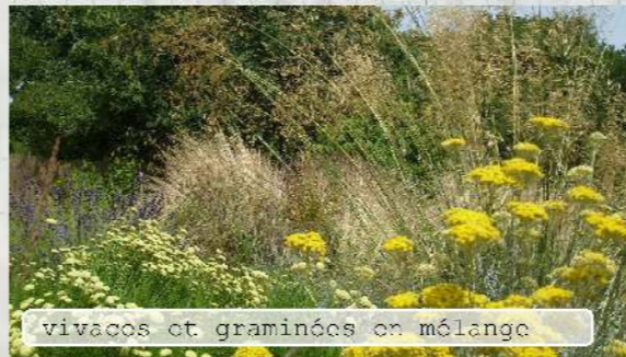
vivaces et graminées en mélange