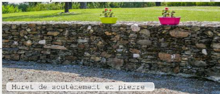
Muret de soutènement en pierre

Le jardin dédié à «l'atelier» bénéficie outre son exposition Sud des proportions facilement exploitables. Il est proposé de traiter l'accès sous la forme de routin, surface perméable roulante, de finition rustique. Une poche de stationnement est conservée près du cabanon réhabilité. D'un côté, une jachère fleurie agrémentée de fruitiers, de l'autre, un gazon fin. Un accès épaulé par une bordure en pavé longe la frange sud de la maison pour permettre une circulation «au sec» entre le garage et la terrasse bois. Côté Ouest, la charmille plantée freine les vents dominants en provenance de la côte et assure une plus grande intimité au cœur de la parcelle. Ici une volée de marches et un muret de soutènement affleurant absorbe la différence de niveau entre le routin et cette extension du salon. La terrasse créée se positionne en léger retrait de l'imposante façade de manière à en apprécier la matière. L'espace préservé au centre de la parcelle se veut en devenir; ses proportions permettant de multiples possibilités d'aménagement.